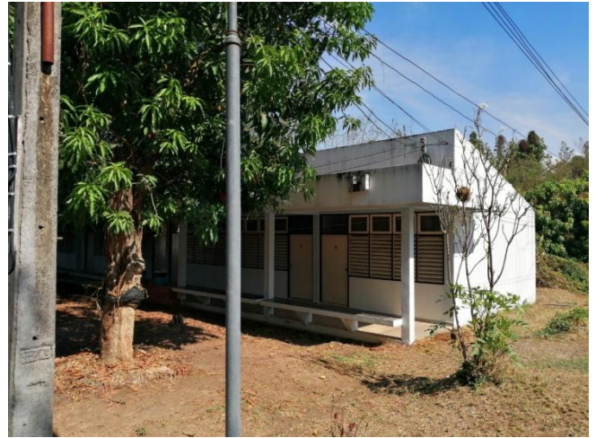
บริเวณภายนอกอาคาร (อาคารสำหรับผู้กักกัน)