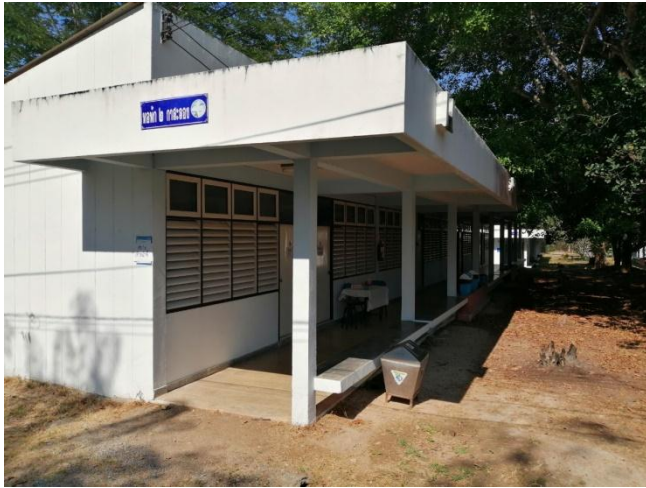
บริเวณภายนอกอาคาร (อาคารสำหรับเจ้าหน้าที่)