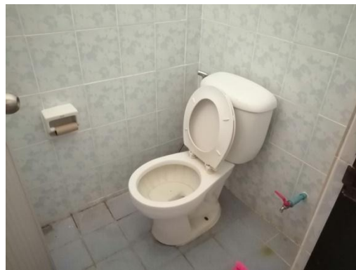
บริเวณภายในห้องพัก